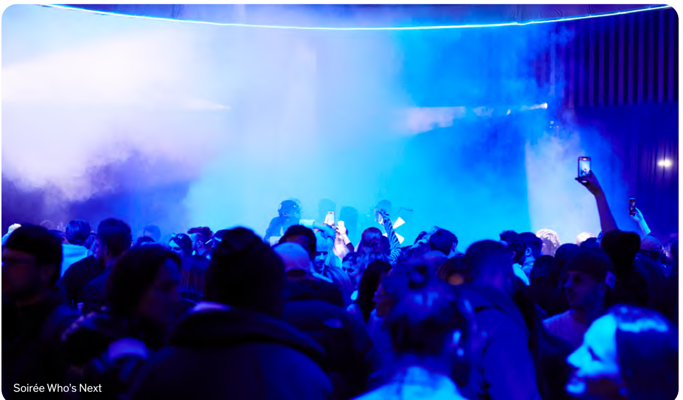
Soirée Who's Next

Enfin, la Fédération Française de Prêt-à-Porter Féminin, véritable mentor des entrepreneurs de l'industrie, apportera son expertise avec des talks et workshops innovants dédiés au marketing digital dans la mode.