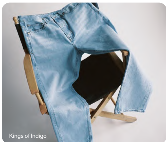
Kings of Indigo

Après un premier succès en 2023, l'association KEIA revient sur IMPACT pour présenter 13 marques créatives et engagées de Corée du Sud : ANARCHIA, BARAMGYEOL, CRADLERE, DLS BY DSLS, DOBB, HARLIEK, HORONG, KKONTHAT, LOVE CHARM, MONTSENU, TEMPS, TOUCH4GOOD, UPMOST.