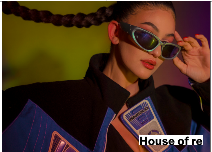
House of re

À l'occasion de ses 150 ans, la BOCI a sélectionné une trentaine de bijoux de créateurs emblématiques de ces années débridées et créatives. Bien plus qu'un témoin de l'essor du bijou entre 1960 et 1990, le salon Bijorhca en a été l'un des principaux vecteurs à l'échelle européenne et mondiale.